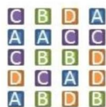
Le groupe d'apprenants