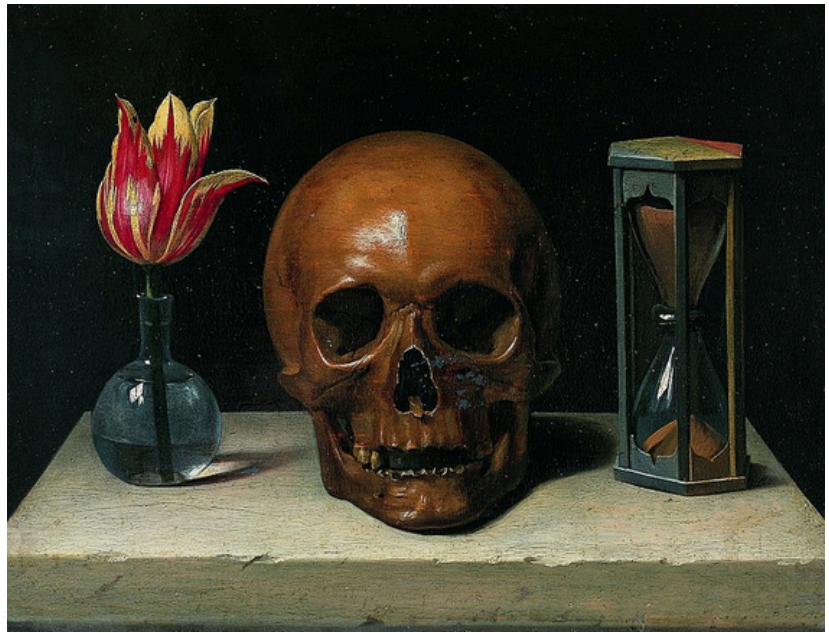
Titre : Auteur : Période / année :