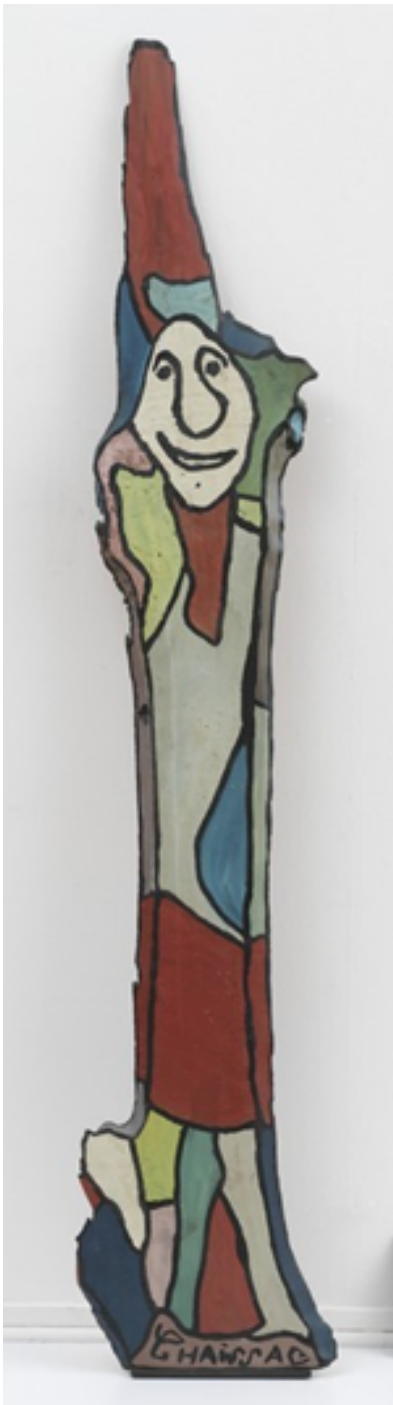
Titre : Auteur : Période / année :