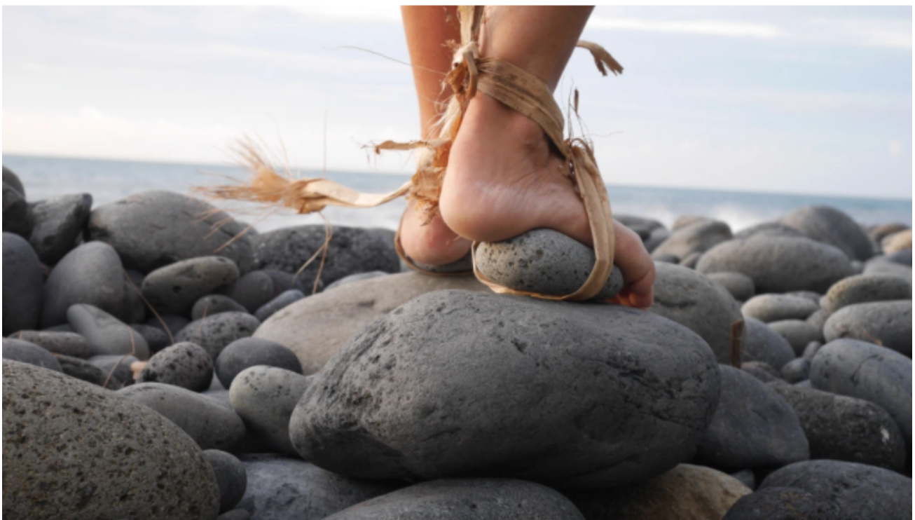
Œuvre de Gwenaëlle Montigné , FUSION I , vidéo-performance , juin 2022, photographie exposée du 25 novembre 2022 au 2 avril 2023 au Musée d'Art et d'Histoire de Cholet dans le cadre de l'exposition MIX , partenariat DRAC et Académie de Nantes

InSitu souhaite à tous les partenaires et enseignants d'arts plastiques une bonne et heureuse année 2023