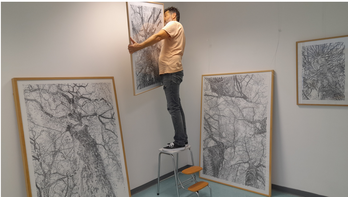
Lycée Savary de Mauléon, Les sables d'Olonne Exposition Arbres de Frederic JAMMES du 1er au 30 septembre 2022

Je félicite les professeurs pour leur réussite aux capes ou agrégations, collègues de plus en plus nombreux à bénéficier des formations académiques préparant aux concours internes de recrutement.