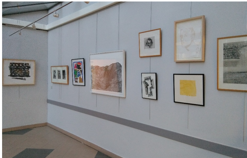
Galerie d'art à vocation pédagogique collège REP+ Jean Lurcat, Angers