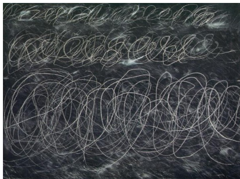
Cy Twombly, Untitled , 1970