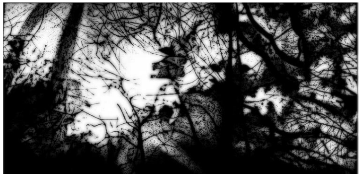
Carole BENZAKEN, Eclésiaste 7 : 24 G , 2008, Mine de plomb, crayon et encre litho, gouache film polyester et caisson lumineux avec néons, 81,5 x 164 x 11,5 cm