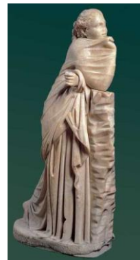
La muse Polymnie, sculpture antique romaine

Pour en savoir plus sur cette exposition, cliquer ici