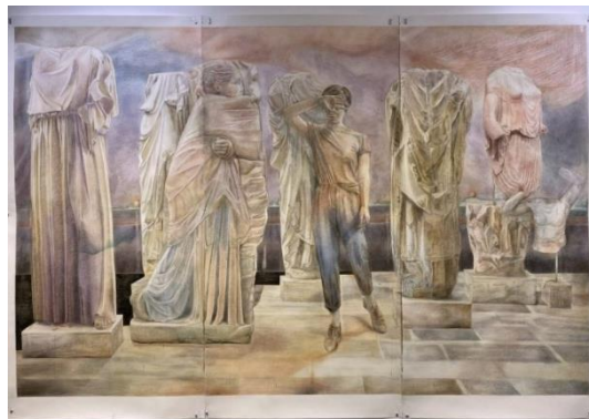
Iris LEVASSEUR, Reconstitution 2020 Pierre noire et aquarelle sur papier, 270 x 290 cm