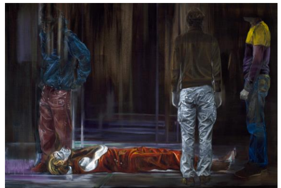
Iris LEVASSEUR, Tauromachie, 2009, Huile sur toile, 205 x 300 cm