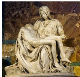
MICHEL ANGE, Piéta, Sculpture, 1498-1499