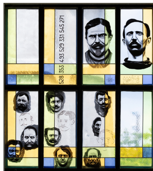
Stéphane Arrondeau/Michel Ducreux Vitrail de la Fonderie d'Antoigné à Saint-Jamme-sur-Sarthe 2007 © Ville du Mans/Paul Hamelin