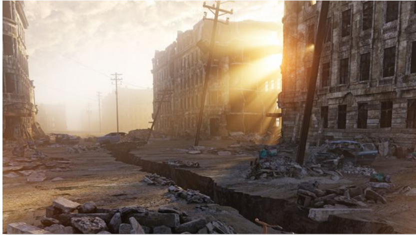
The Last of Us