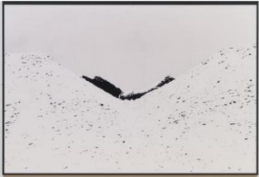
Dennis OPPENHEIM Parallel Stress , 1970, Tate Modern