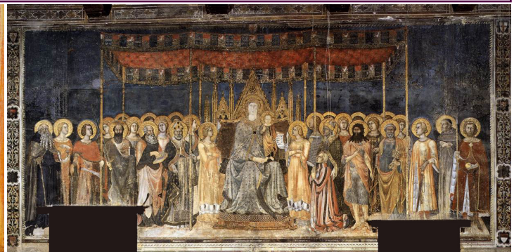
MEMMI Lippo, Maesta, fresque, 1317, palazzo comunale in san gimignano

Plans : juxtaposition, étagement, profondeur de champ, montrer-cacher, frontalité, hiératisme, variété, dynamisme, potentiel narratif.