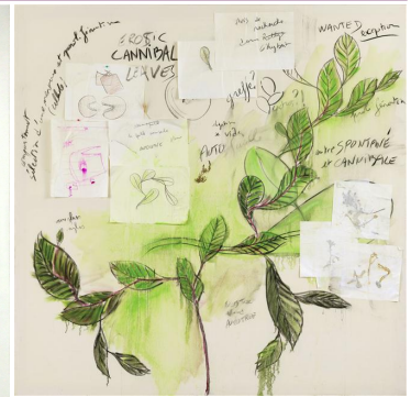
HYBER Fabrice, Sans titre, feutre, fusain, pastel, pigment sur papier, 200x200cm, 2001, Paris, Centre G. Pompidou

À l'aide des mots clefs ci dessous, décris les différences que tu peux remarquer entre tes deux réalisations.