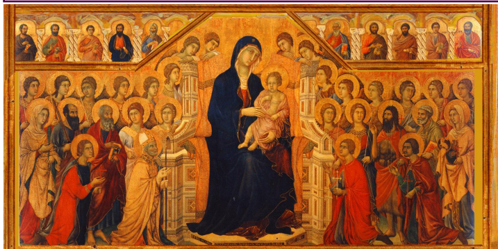
DUCCIO DI BUONINSEGNA, maesta, détail, tempera et or sur bois, 1308-11, Sienne, museo dell'opera del Duomo

Personnages : caricature, portrait, en pied, en buste, fragments, raccourcis.