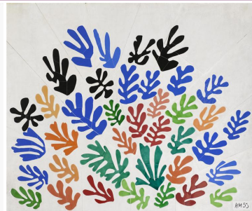
MATISSE Henri, La Gerbe, céramique, 274x396 cm, 1953, Los Angeles, Los Angeles County Museum