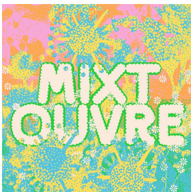
Ouverture de Mixt (44)