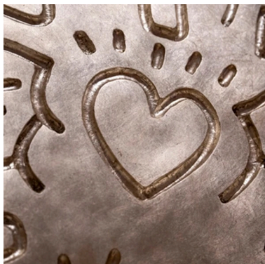
Exposition À cœurs ouverts (44)