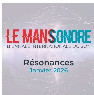
Le Mans Sonore (72)