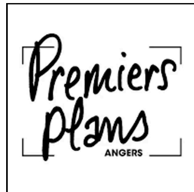
Premiers Plans (49)