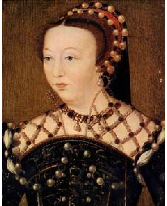
Le dernier portrait en date de Catherine

On parle beaucoup de Diane... Mais qu'en est-il de Catherine ? Et oui, celle qu'on appelle désormais "l'officielle" du roi ne doit pas beaucoup apprécier la venue d'une petite insolente comme Diane à la cour. Et puis bon, on ne va pas se le cacher mais Catherine ne représente pas vraiment l'archétype de beauté attendu d'une reine. C'est bien triste à dire mais il faut croire que nous ne sommes pas tous dotés des mêmes atouts à la naissance... Ceux de Catherine se résument à des yeux globuleux, et une figure affaissée qui aurait bien besoin d'une lotion tonique ! Cependant, il faut bien reconnaître que son évidente disgrâce est compensée par une intelligence et une réflexion qui ne sont pas données à tout le monde.