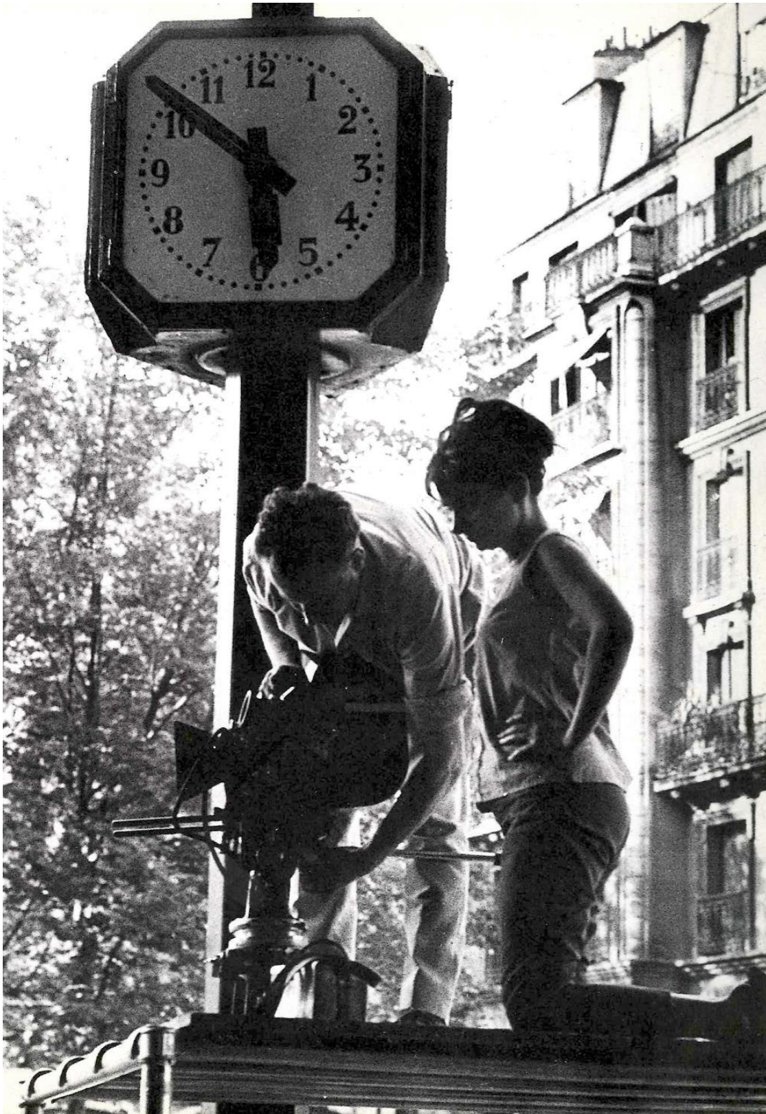
Varda par Agnès, in Cahiers du cinéma , 1994.