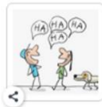
Ce qui est comique