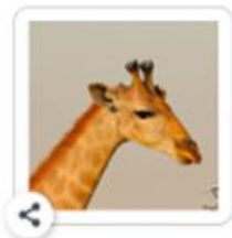
J'ai peigné la girafe