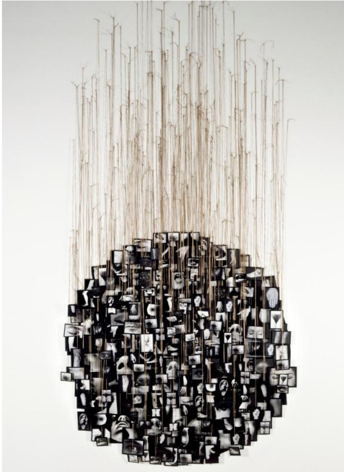
Annette MESSAGER, série Mes vœux , 1988, installation de fragments photographiques