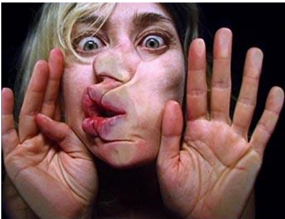
Photographie extraite de la vidéo performance de Pipilotti Rist, Open My Glade (ouvrir mon horizon) en 1997 à Time square à Londres sur les écrans publicitaires