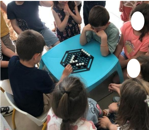
Finale des CP/CE1 :