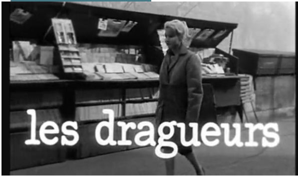
J.-P. Mocky, Les Dragueurs, 1959 [extrait, 0:00–3:50]