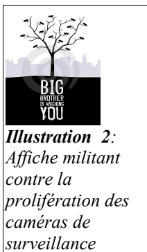
Illustration 2: Affiche militant contre la prolifération des caméras de surveillance