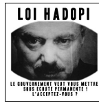
Illustration 4: Affiche militant contre l'application de la loi Hadopi (2009)

Bilan: Quelles remarques pouvez-vous faire sur l'héritage de 1984 ? En élargissant un peu la réflexion, dites ce qu'est, selon vous, un « classique » en littérature.