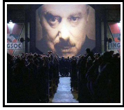
Illustration 3: la semaine de la haine (1984 - adaptation cinématographique, 1956)