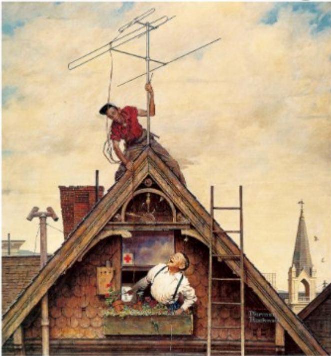
« The New Television Set » by Norman Rockwell vs the Church steeple in the background