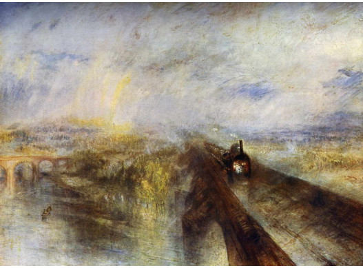
William Turner « Pluie, Vapeur et Vitesse, le grand chemin de fer de l'Ouest » 1844 peinture à l'huile