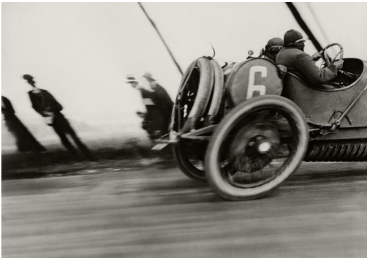
Jacques-Henri Lartigue, "Grand Prix de l'ACF..."1912, photographie