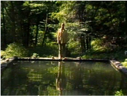
The Reflecting Pool , 1977-79