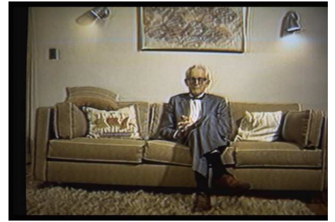
Reverse Television - Portraits of Viewers, 1983-1984