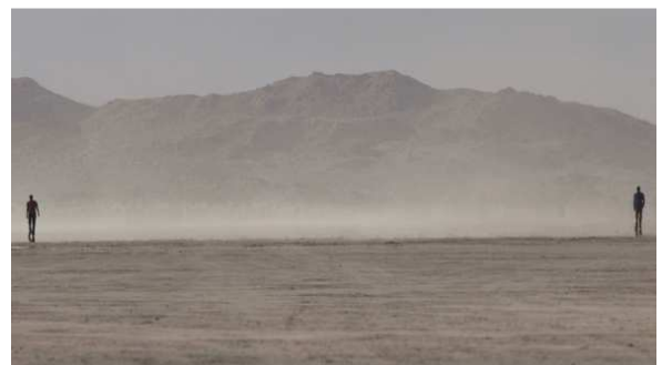
The Encounter, 2012