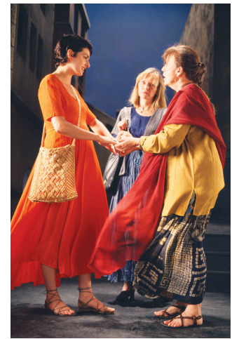
The Greeting, 1995