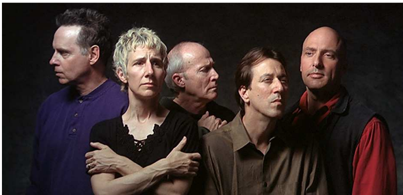
The Quintet of the Astonished, 2000