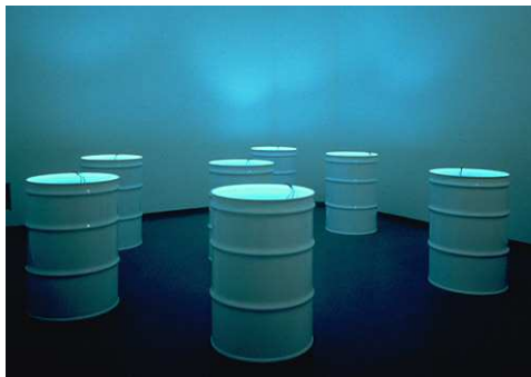
The Sleepers, 1992