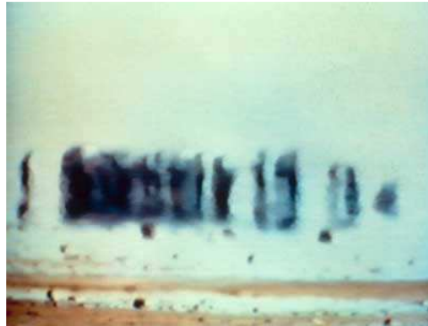
Chott El-Djerid, 1979