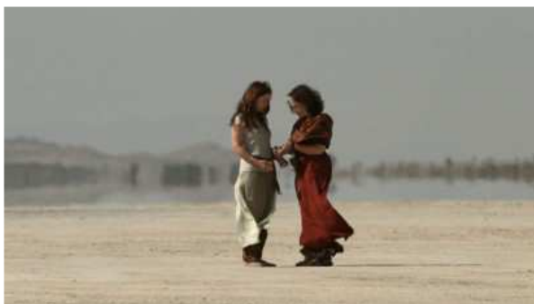
Walking on the Edge, 2012