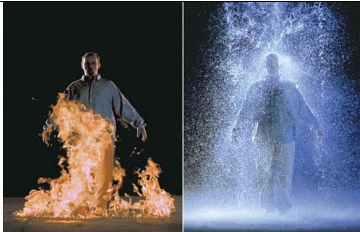
The Crossing, 1996