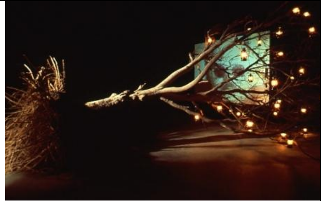
The Theater of Memory, 1985