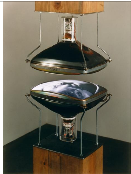
Heaven and Earth, 1992