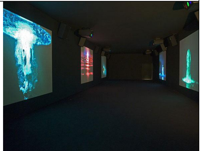
Five Angels for the Millennium, 2001