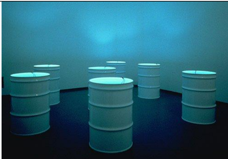
The Sleepers, 1992