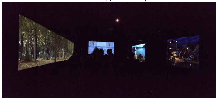
Going Forth By Day, 2002