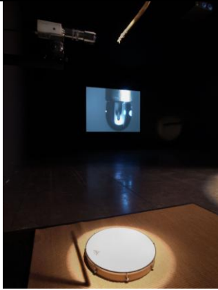
He Weeps for You, 1976