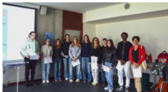
Les représentants de l'équipe gagnante de la série STL et leur enseignante (lycée Réaumur, Laval)

« Je leur conseillerais de faire un projet qui leur ressemble , dans lequel ils prennent plaisir et s'amuse, quelque chose de créatif . Il faut bien s'organiser, ne pas s'entêter sur une idée, être à l'écoute des autres car chacun a une idée à apporter. Il faut répartir les rôles importants et s'écouter les uns les autres pour faire évoluer l'idée. »