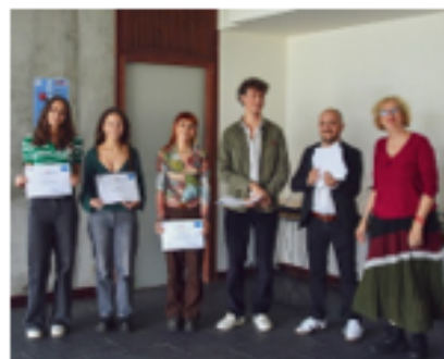
Les représentants de l'équipe gagnante de la série STMD et leurs enseignants d'ETLV (lycée Joachim du Bellay, Angers)

« Leur montrer que l'anglais, ça n'est pas juste de la grammaire, de l'orthographe, dans des thèmes dont ils ne voient pas forcément l'intérêt, alors que là c'est vraiment appliqué à ce qu'ils vont rencontrer comme situation professionnelle plus tard. »