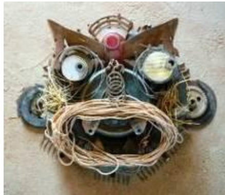
matériaux divers – Anonyme