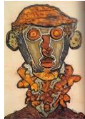
épluchures – P. Dereux