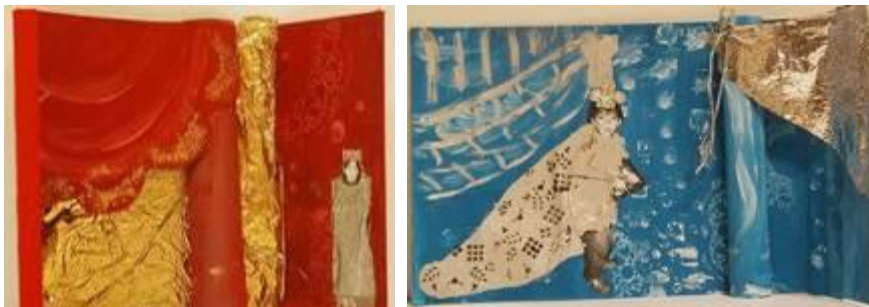
Réalisations CM2 de l'école Georges Lapiere au Mans