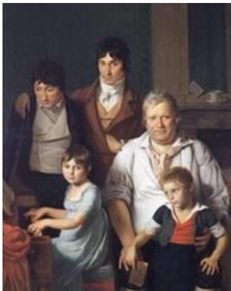
Portrait de famille, Anonyme, huile sur toile XIXème siècle.

Dans le cadre du parcours d'éducation artistique et culturelle, les élèves bénéficient de rencontres sensibles avec des œuvres qu'ils sont en mesure d'apprécier. Selon la proximité géographique, des musées, des ateliers d'art, pourront être découverts ; ces sorties éveillent la curiosité des élèves pour les activités artistiques de leur région.