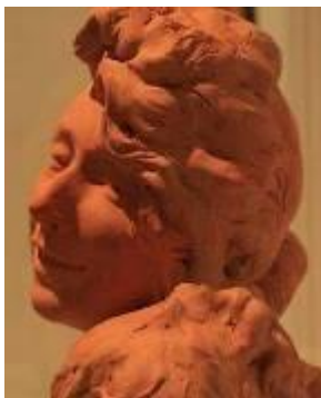
Mme Champsaur - A. Bourdelle

Cette salle nous présente également des portraits sculptés, en terre, en récup'art, une autre façon d'illustrer un personnage, plus proche de la réalité?