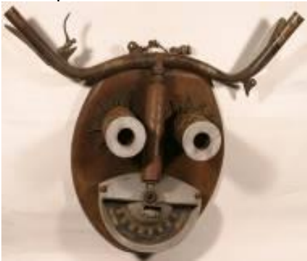
matériaux divers – G. Floquet

- Les artistes du récup'art nous proposent divers types de matériaux pour prolonger la recherche sur le portrait en volume :