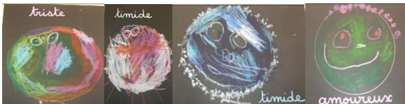
Visages expressifs, pastels gras- moyenne section, maternelle G. Braque - Coulaines.