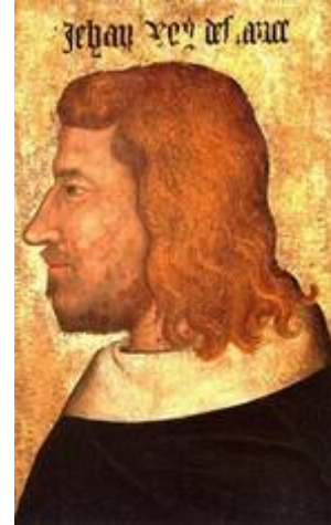
Jean le Bon, roi de France Anonyme - milieu du XIVè

De l'Antiquité jusqu'au Moyen Âge, dans la tradition, on privilégie le portrait de profil.