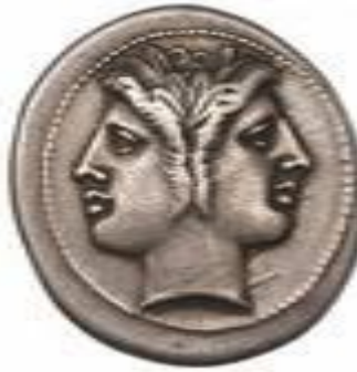
monnaie grecque avec double profil de Jupiter. 216 av JC